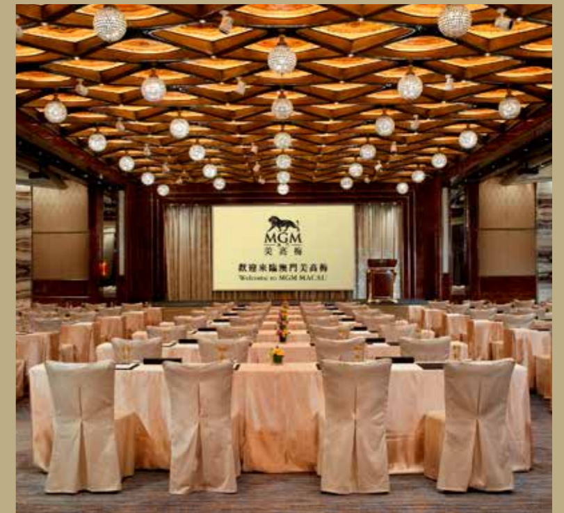
大宴会厅 The Grand Ballroom