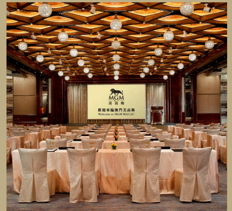
大宴會廳 The Grand Ballroom