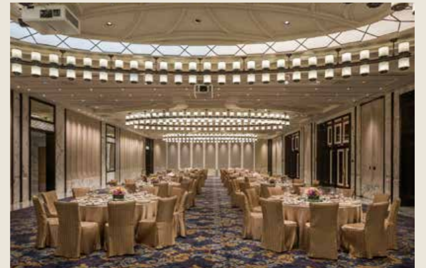
多功能厅 GRAND SALON