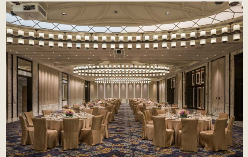
多功能厅 GRAND SALON