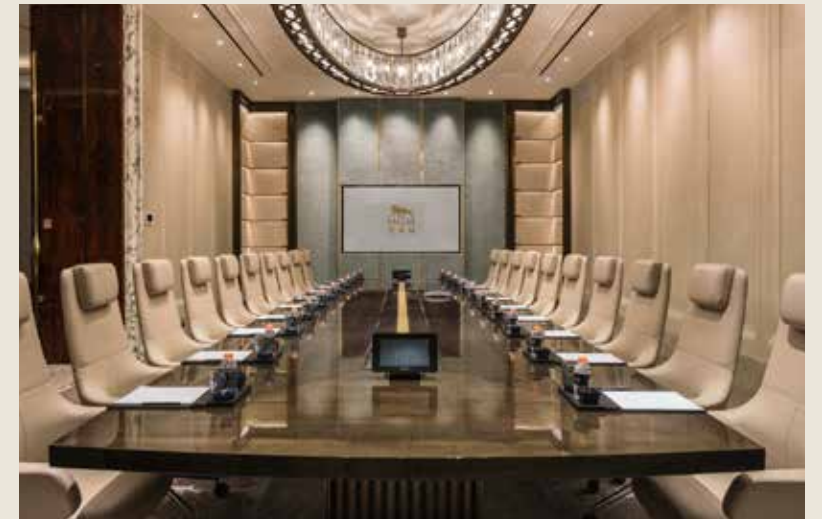
會議室 BOARD ROOM