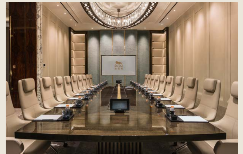
會議室 BOARD ROOM