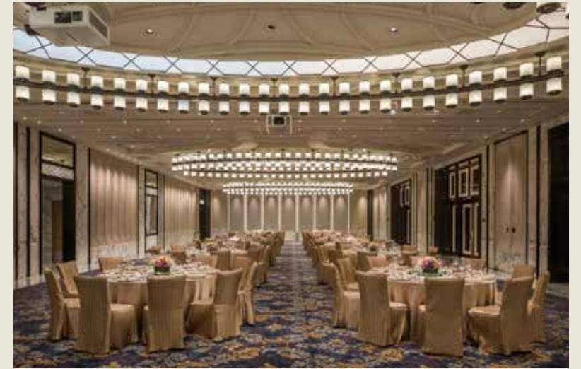
多功能廳 GRAND SALON